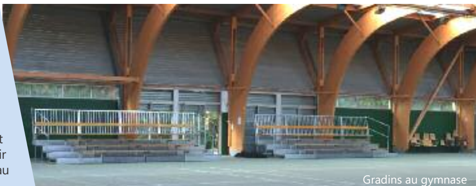
Gradins au gymnase