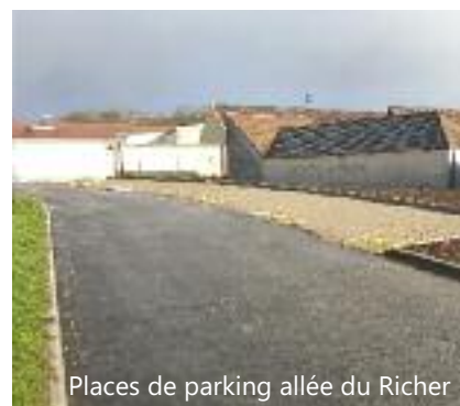
Places de parking allée du Richer