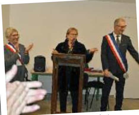
Inauguration des travaux d'extension du gymnase, discours de Mme CAVECCHI, présidente du Conseil Départemental