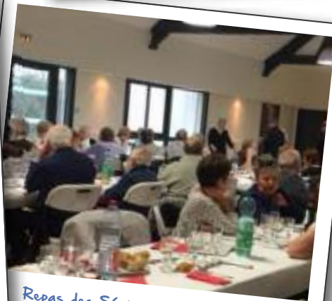
Repas des Séniors - 5 janvier 2019