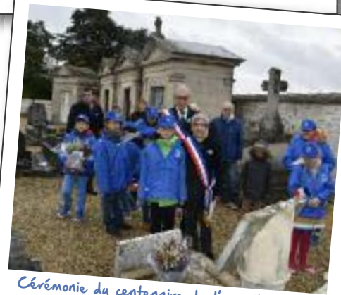
Cérémonie du centenaire de l'armistice 1918 11 novembre 2018