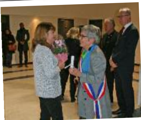
Remise des diplômes des médaillés du travail Cérémonie des Vœux, 4 janvier 2019