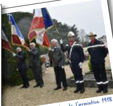
Cérémonie du centenaire de l'armistice 1918 11 novembre 2018