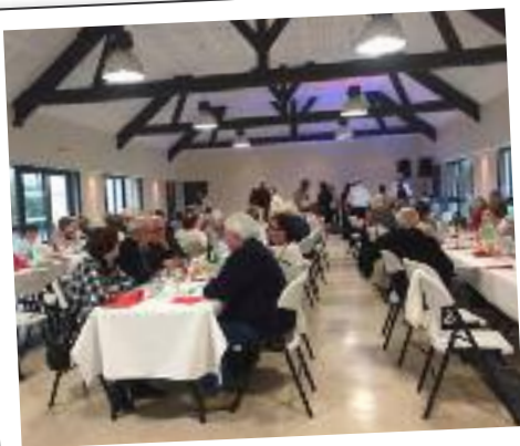
Repas des Séniors - 5 janvier 2019