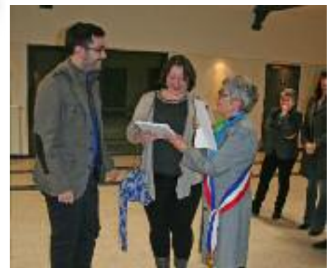
Accueil des nouveaux habitants lors de la cérémonie des vœux, 4 janvier 2019