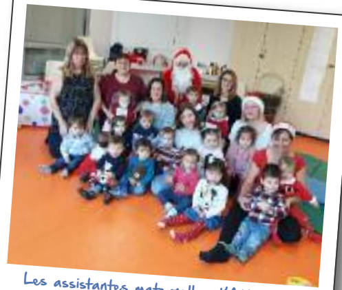
Les assistantes maternelles d'Attainville se retrouvent les mardis et jeudis, dans la structure communale depuis décembre 2018