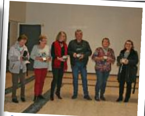
Remise de la médaille de la ville pour les bénévoles après la médaille du département