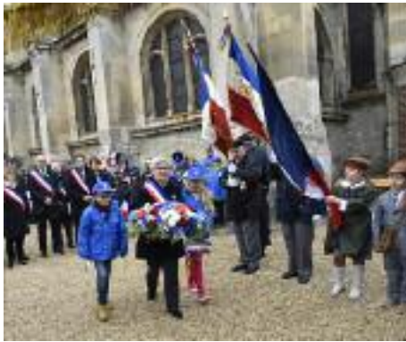
Cérémonie du centenaire de l'armistice 1918 11 novembre 2018