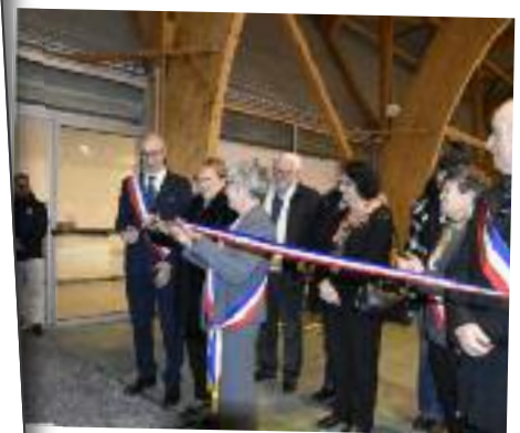
Inauguration des travaux d'extension du gymnase - 17 décembre 2018