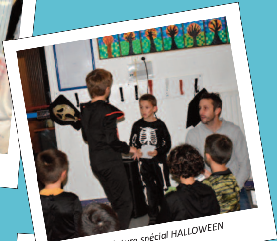
Jeu Grandeur Nature spécial HALLOWEEN 20 octobre 2023