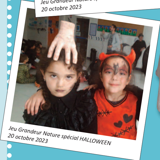
Jeu Grandeur Nature spécial HALLOWEEN 20 octobre 2023