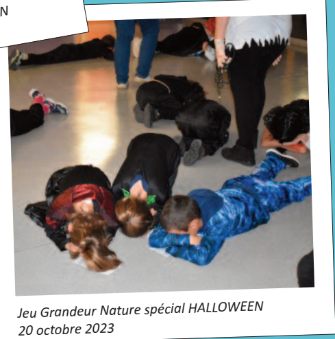
Jeu Grandeur Nature spécial HALLOWEEN 20 octobre 2023