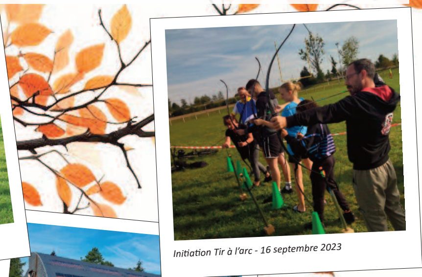
Initiation Tir à l'arc - 16 septembre 2023