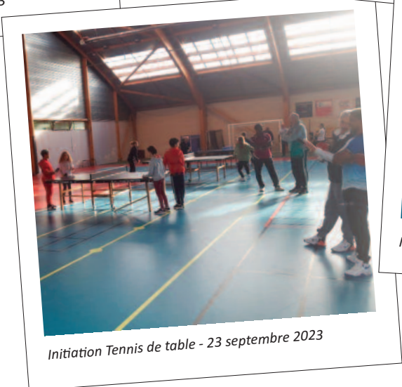
Initiation Tennis de table - 23 septembre 2023