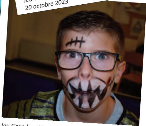
Jeu Grandeur Nature spécial HALLOWEEN 20 octobre 2023