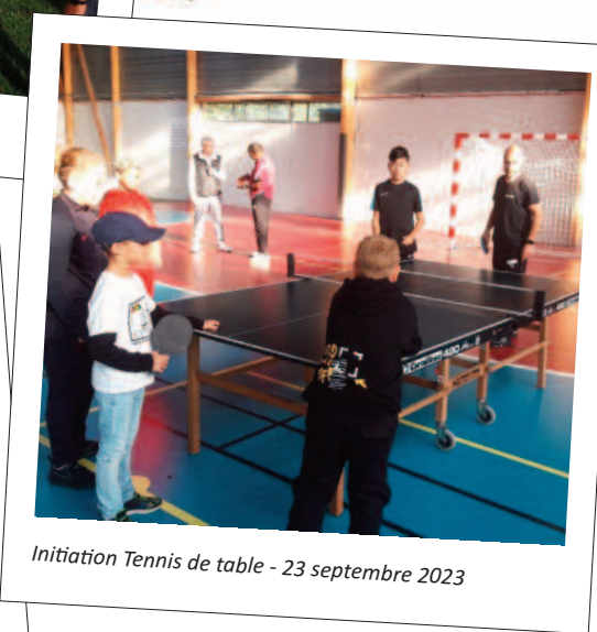
Initiation Tennis de table - 23 septembre 2023