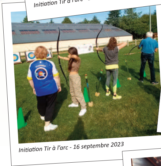
Initiation Tir à l'arc - 16 septembre 2023