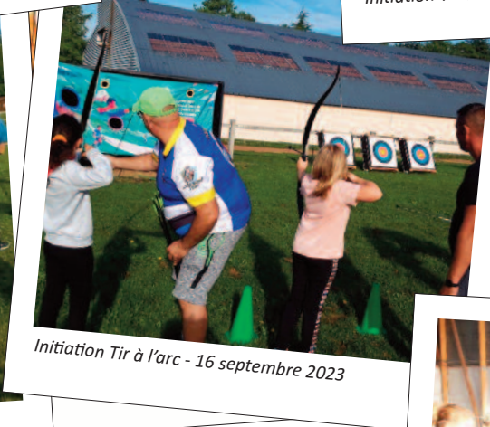
Initiation Tir à l'arc - 16 septembre 2023