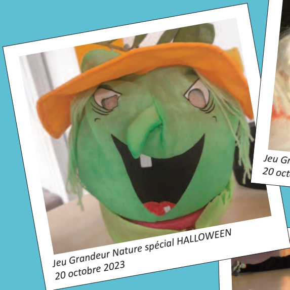
Jeu Grandeur Nature spécial HALLOWEEN 20 octobre 2023