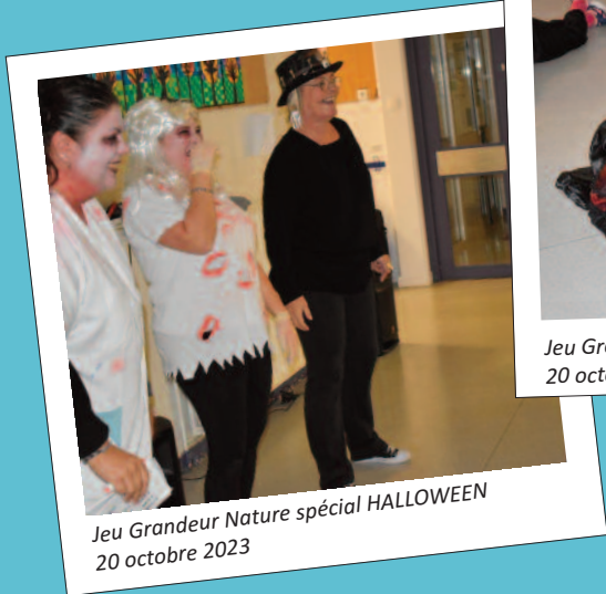
Jeu Grandeur Nature spécial HALLOWEEN 20 octobre 2023