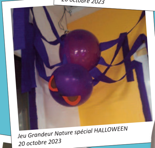
Jeu Grandeur Nature spécial HALLOWEEN 20 octobre 2023