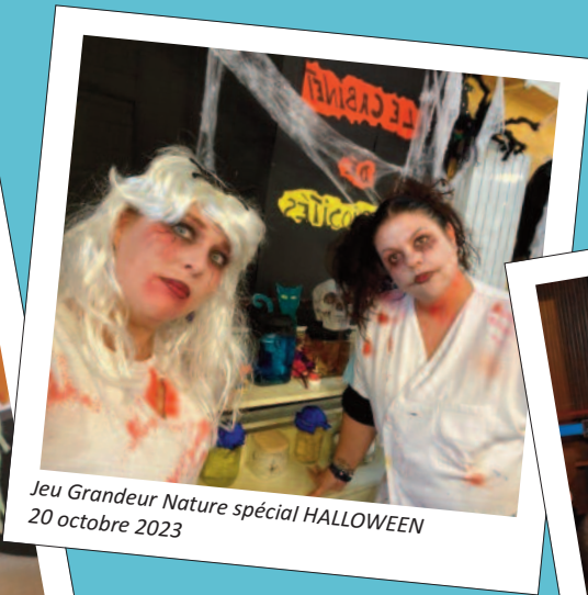
Jeu Grandeur Nature spécial HALLOWEEN 20 octobre 2023